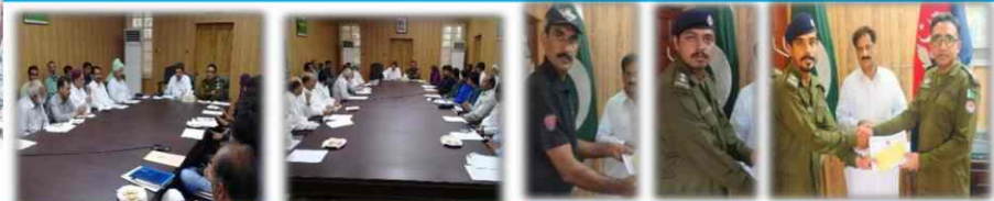
DPO Khushab conducting meeting with candidates of general election 2018.