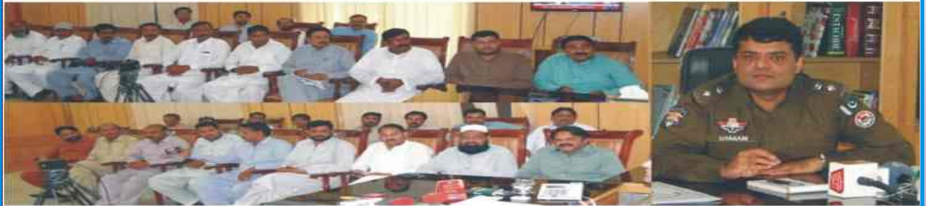
لودھراں: ڈی پی او عثمان اعجاز باجوہ صحافیوں کے ساتھ تعارفی میٹنگ کر رہے ہیں۔