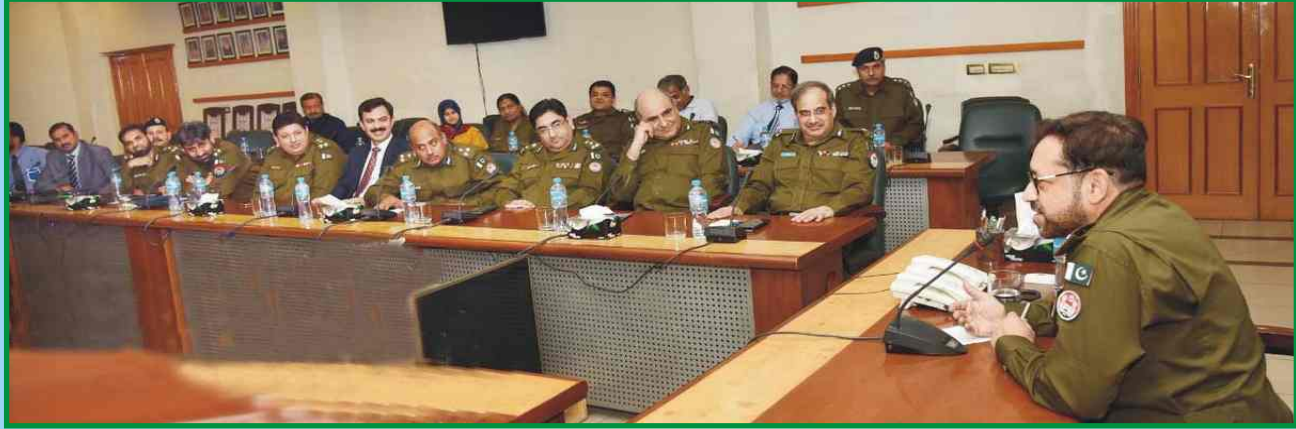
آئی جی پنجاب ڈاکٹر سید کلیم امام، سنٹرل پولیس آفس پنجاب لاہور میں سینئر پولیس افسران کی میٹنگ سے خطاب کر رہے ہیں