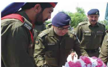
DPO Mianwali visited the Yadgar-e-Shuhda