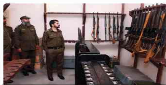
Inspection of Kot