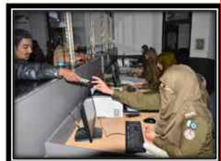
Citizens at Police Khidmat Markaz