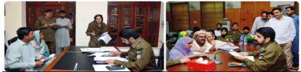
Daily open court