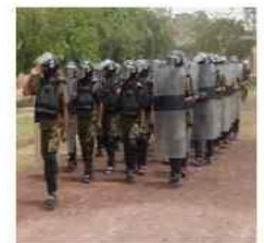
Anti Riot Course Passing Out parade