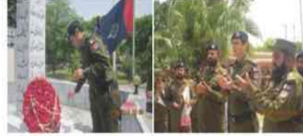
ڈی پی او مسٹر گھنٹھ لعل شوہر کی پدم شہاہی سہاہی