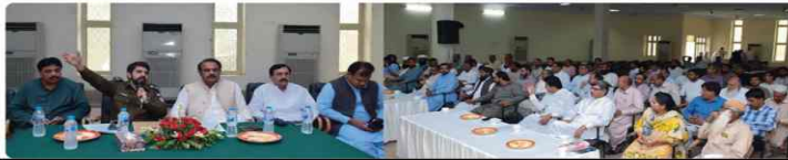
Meeting with candidates