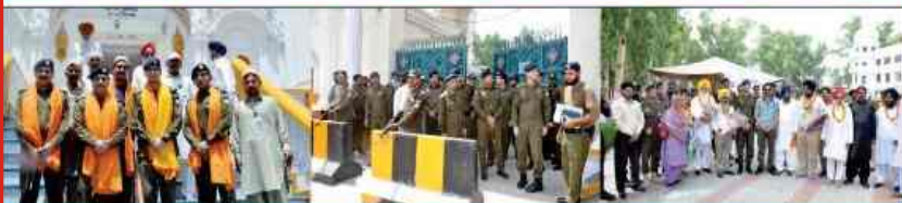
DPO Sheikhupura welcomed Sikh yatrees & ensured foolproof security arrangements on their arrival at Sucha Soda