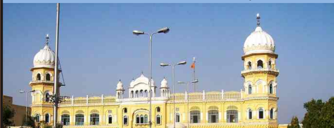
GURDWARA JANAM ASTHAN Nankana Sahib. The Birth place of Baba Guru Nanak Dev Jee.