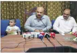
12 کروڑ روپے تادان کے لئے اغواء ہونے والے بچے کو ملزمان کے بازیاب کرایا

ڈی پی او ڈیرہ غازیخان احمد نواز چیمہ نے اپنی تعیناتی کے دوران ڈیرہ غازیخان میں تزئین آرائش کے بہت سے کام کروائے پولیس لائن میں تزئین آرائش بھی کرائی جبکہ پولیس ملازمین کو فائزرنگ پریکٹس کروا کر ان کو حوصلے بلند اور خود اعتمادی پیدا کرنے کے لئے پولیس لائن میں فائزرنگ ریٹیج ہوائی اسی طرح ڈی پی او احمد نواز چیمہ نے اپنی تعیناتی کے دوران دیگر بہت سے ایسے کام کئے جن کی تفصیل ذیل ہے۔