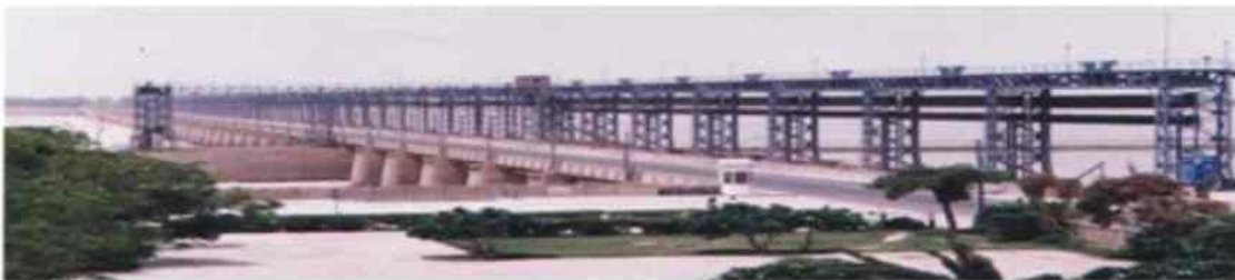
پہلا قاتل سرجن مسٹر گھنٹھ