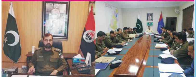
DPO Meeting With SDPOs And SHOs On Law & Order Situation