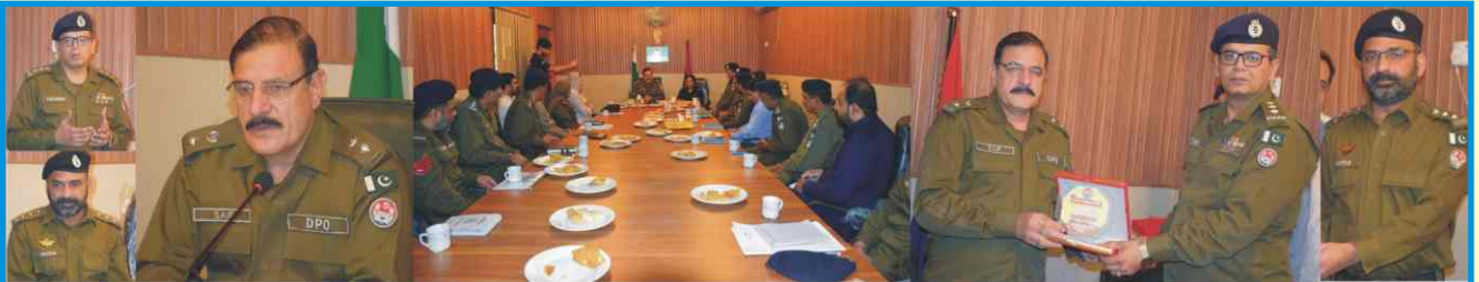
ڈی پی او آفس حافظ آباد میں ٹرانسفر ہونے والے ڈی ایس پی صاحبان کے اعزاز میں منعقد ہونے والی الوداعی تقریب کی تصویریں جھلکیاں