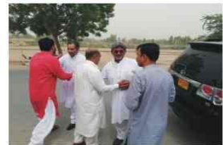
شہداء پولیس کے لواحقین سے ملنے ہوئے