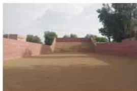
پولیس لائن میں ڈیرہ غازیخان میں بنائی گئی فائزرنگ ریٹیج