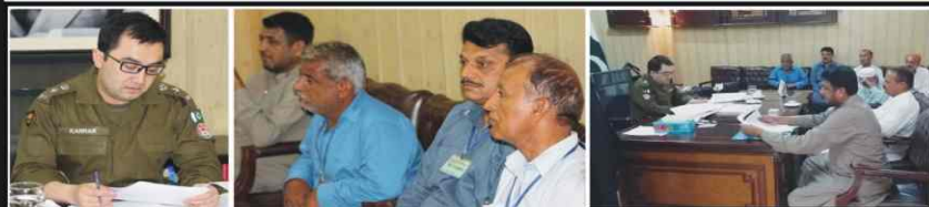
DPO Mianwali listening and resolving the issues of complaints.