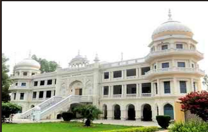
Gurdawara Sacha Sauda in Farooqabad