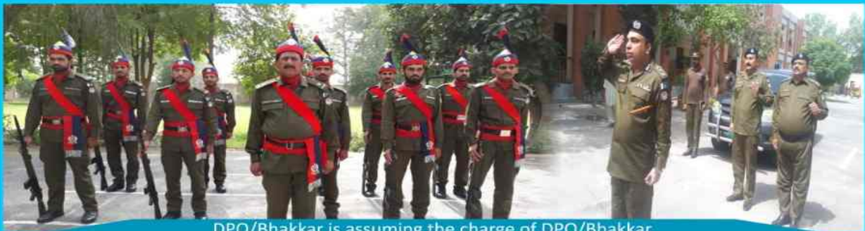
DPO/Bhakkar is assuming the charge of DPO/Bhakkar.