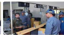
Visit of Khadimat Markaz Khanewal