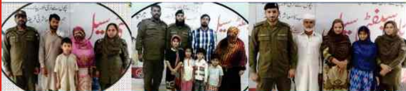
Child Safety Cell returned 23 lost child to their parents & concerned department