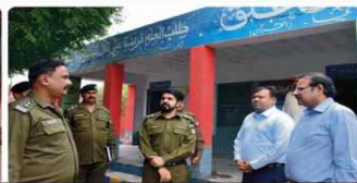
Visit of sensitive Polling Stations