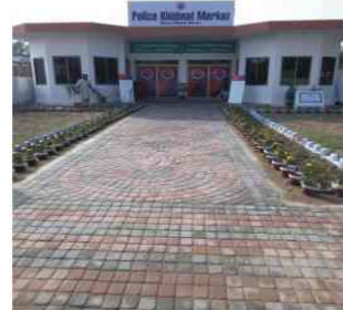
پولیس خدمت مرکز سنٹر