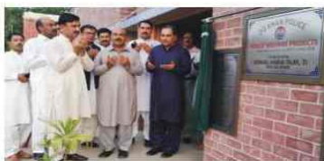
پولیس آفیسر میں کا افتتاح کرتے ہوئے