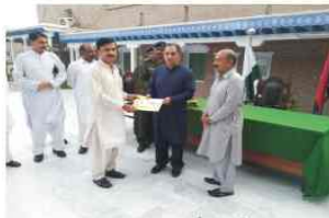
ابھی کارکنی پر انعام دینے ہوئے