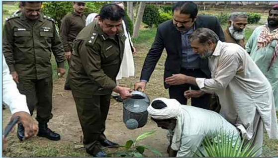
ڈسٹرکٹ پولیس آفیسر احمد ناصر عزیز ورک گورنمنٹ کالج ایملی میں شجرکاری کے حوالے سے پودا لگا رہے ہیں۔