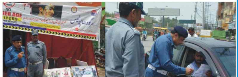
Special campaign regarding "Say no to under age driving" by Traffic Police Sargodha