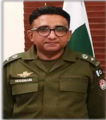
Message of DPO Khushab

The district Police Khushab have been striving hard to combat crime and maintain law and order in the district. We take pride in our sacrifices made while performing our lawful duties. We are not only prepared to surmount the current challenge of conducting General Election 2018 smoothly, but also aspirant to excel in our profession by equipping our selves with the required knowledge and skills.