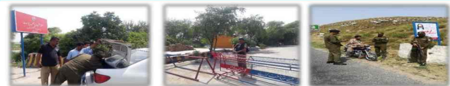
DPO Khushab has been revised all entry/exit check posts for effective surveillance.