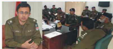
SP/Inv. Meeting with IO's of homicide investigation unit