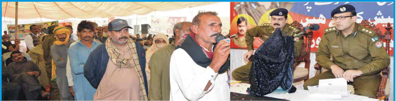
اوکاڑہ: ڈسٹرکٹ پولیس آفیسر حسن اسد علوی بصیر پور کھلی کچھری میں عوامی مسائل کو بغور سنتے ہوئے۔