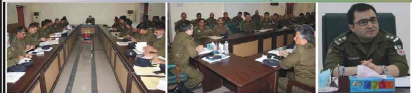
DPO Mianwali held meeting with SDPOs & SHOs