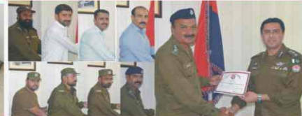
DPO Sargodha distribution cash reward among officials