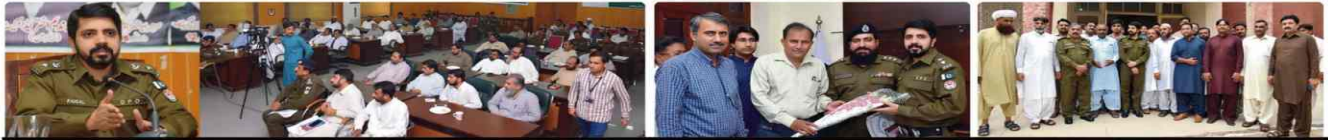
Meeting with journalists