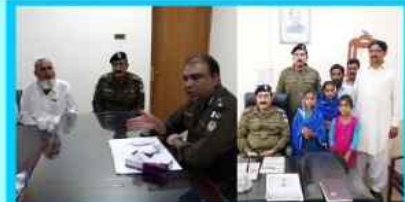
On the special directions of DPO/Bhakkar, SP/Inv. Bhakkar alongwith SDPO/Saddar and SHO/Saddar recovered 03 missing Girls.