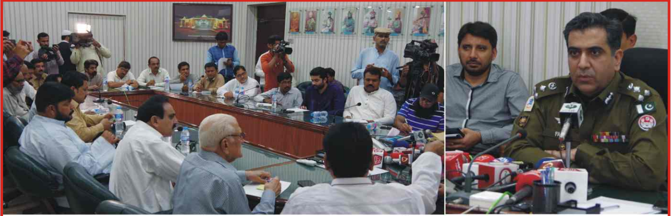
بہاولپور: ریجنل پولیس آفیسر محمد فیصل رانا ایکشن کے حوالے سے میڈیا کے نمائندگان سے گفتگو کر رہے ہیں