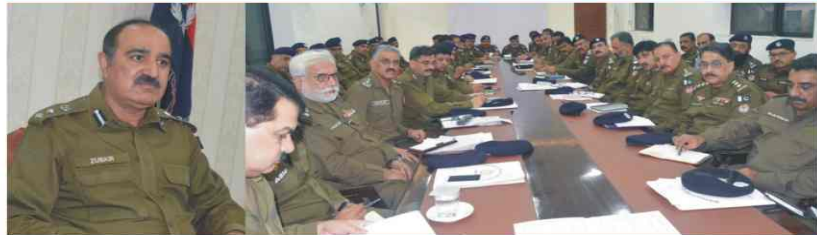
DPO meeting with SDPOs and SHOs on Law & Order Situation