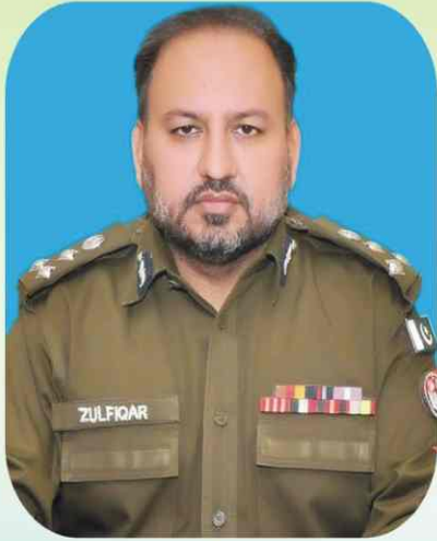
ذوالفقار حمید ریجنل پولیس آفیسر گوجرانوالہ

تھانہ کلچر میں مثبت تبدیلی، پولیس افسران اور جو انوں کی فلاح و بہبود بنیادی ترجیحات ہیں۔