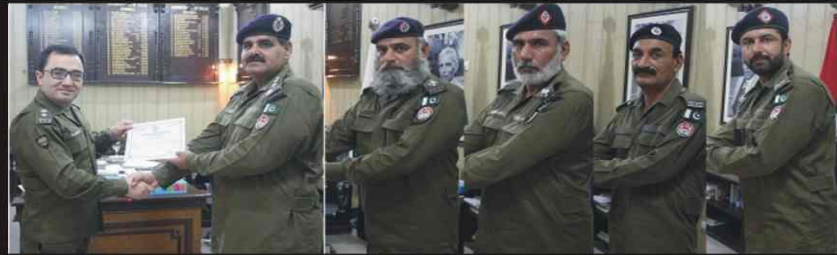
DPO Mianwali awarded commendation certificates with cash rewards for recovery of Narcotics