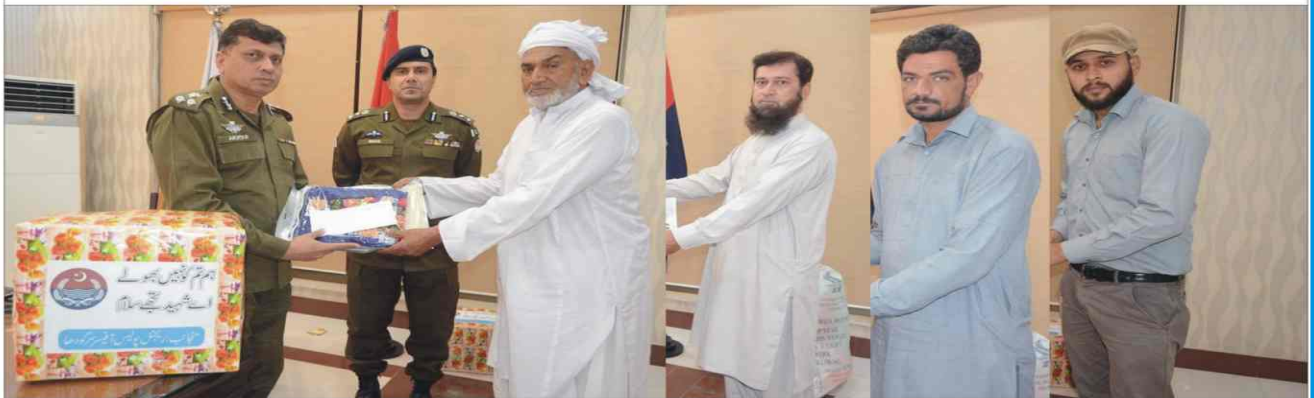
RPO Sargodha distributed Eid Gift Hampers among the families of shuhada before Eid-ul-Fitr