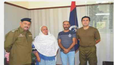
Victim family praising Sargodha on solving murder case