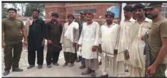
تھانہ خان گڑھ کی کاروائی شراب فروش گیٹنگ گرفتار