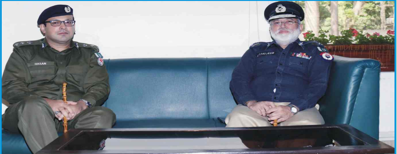
اوکاڑہ: انسپکٹر جنرل آف پولیس پاکستان ریلویز ڈاکٹر مجیب الرحمان اور ڈی پی او اوکاڑہ حسن اسد علوی ملاقات کرتے ہوئے۔