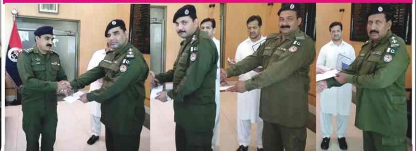
DSP Kamalia is distributing awards amongst police officials on behalf of DPO in recognition of their good performance