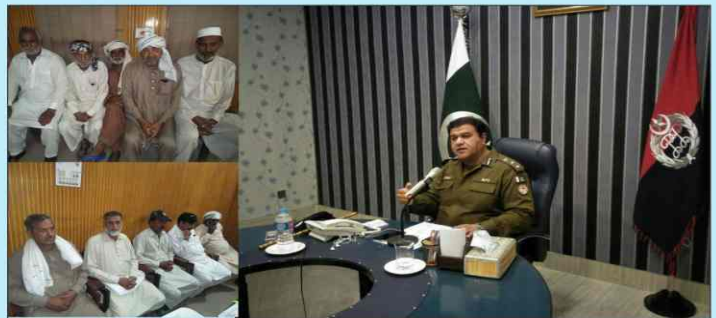
ڈسٹرکٹ پولیس آفیسر احمد ناصر عزیز ورک پولیس ملازمان کو لیوان کیشمنٹ کی چیک کی تقسیم کے دوران خطاب کرتے ہوئے۔