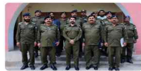
Meeting with Mian Channu Circle