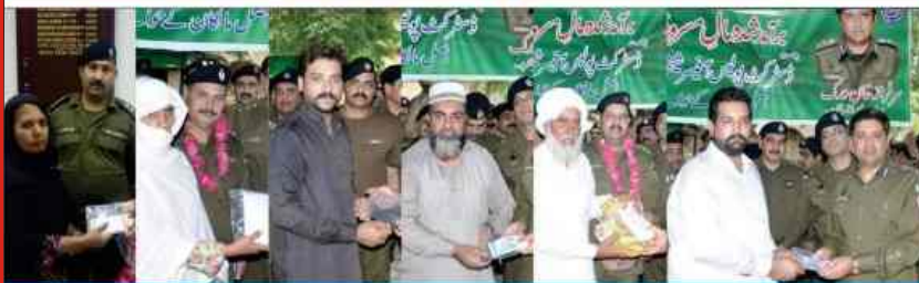
DPO Sheikhupura distributing recoveries among real owners of cases