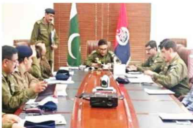
DPO Khushab conducting meeting with SDPOs & SHOs regarding general elections 2018 and district crime.

The district Police Khushab have been striving hard to combat crime and maintain law and order in the district. We take pride in our sacrifices made while performing our lawful duties. We are not only prepared to surmount the current challenge of conducting General Election 2018 smoothly, but also aspirant to excel in our profession by equipping our selves with the required knowledge and skills.