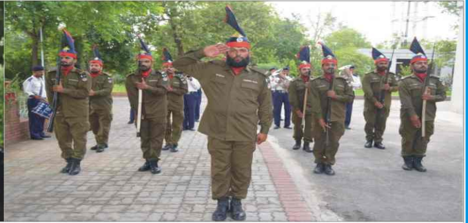
Deputy Inspector General of Poice Sultan Ahmad Chaudhry assumed the charge as RPO Sargodha