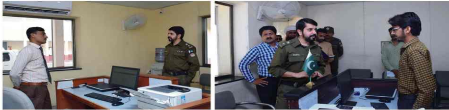
Visit Front Desk