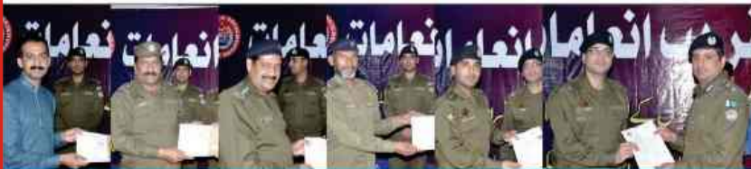
DPO Sheikhupura distributing cash reward & cc-III to police officers