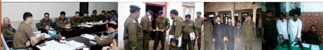
DPO Sheikhupura conducting meeting with SDPOS & SHOS regarding general Election 2018.