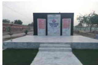
پولیس لائن میں بنی بنائی گئی یادگار شہداء