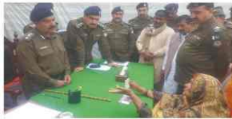
دوران کھلی کچھری سماجی کے مسائل سننے ہوئے