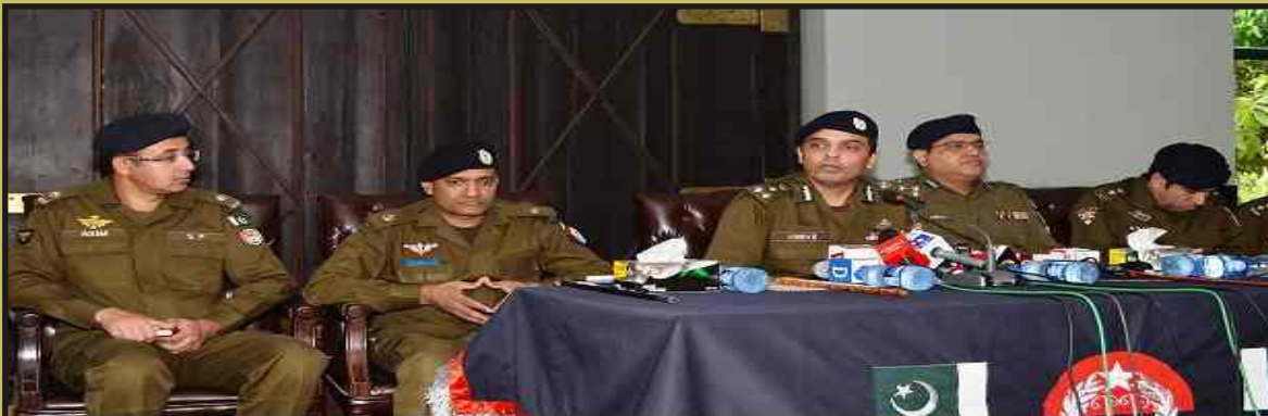
راولپنڈی: سی پی او اور راولپنڈی عباس احسن سی پی او دفتر میں میڈیا نمائندگان کے ساتھ پریس بریفنگ کر رہے ہیں۔