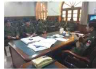
ڈی پی او سینٹنگ برائے سیکورٹی پلان