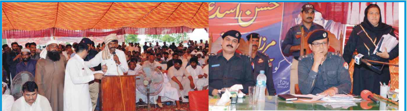
اوکاڑہ: ڈسٹرکٹ پولیس آفیسر حسن اسد علوی بصیر پور حویلی لکھاروڈ پر غازی پورہ کے مقام پر منعقدہ کھلی کچھری میں عوام الناس کے مسائل سن رہے ہیں۔