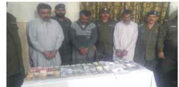
بین الصوبائی کیش سٹیجی کریم گرفتار کر کے 50 لاکھ رقم برآمدی