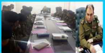
DPO/Bhakkar is presiding a meeting with SDPOs and SHOs regarding Law & Order situation.