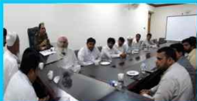
DPO/Bhakkar hold a meeting with Media Advisors of all Politicians regarding code of conduct of Election-2018