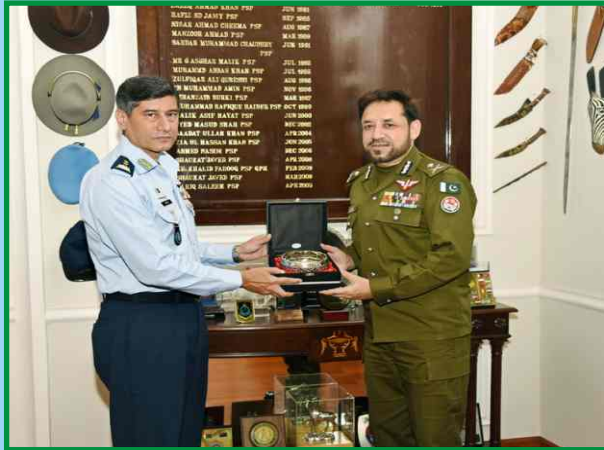
آئی جی پنجاب ڈاکٹر سید کلیم امام، سنٹرل پولیس آفس میں ائروائس مارشل عرفان احمد کو پنجاب پولیس کا یادگاری سوومینٹرز پیش کر رہے ہیں