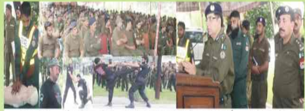
گوجرانوالہ۔ سی پی او آفس کاوزٹ میں پولیس لائٹنگ میں پولیس افسران کا ٹریننگ سیشن۔