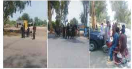
محلی عورتوں کو ایف پی او نے اپنی سیکورٹی پر توجہ دینی اور وہ اپنی سیکورٹی کے لئے توجہ دینی مسٹر گھنٹھ لعل شوہر کی پدم شہاہی سہاہی کی سیکورٹی اور ایف پی او نے اس پر توجہ دینی اور وہ اپنی سیکورٹی کے لئے توجہ دینی ڈی پی او نے ایف پی او کی سیکورٹی پر توجہ دینی اور وہ اپنی سیکورٹی کے لئے توجہ دینی گروہ کی سیکورٹی کی طرف سے ایف پی او نے توجہ دینی اور وہ اپنی سیکورٹی کے لئے توجہ دینی

میری تعیناتی کی پہلی ترجیح ضلع مظفر گڑھ میں صاف شفاف اور پرامن انکیشن کا انعقاد ہے۔ میں فورس کی فلاح و بہبود کیلئے تمام مناسب وسائل بروئے کار لاؤں گا۔ پبلک کیلئے میرے دروازے ہر وقت کھلے ہوں گے۔ عوام و فورس کے ممبران بغیر پرچی کے کسی بھی وقت مجھ سے ملاقات کر سکتے ہیں۔ اساتذہ، صحافی، جاہل و گاہ اور تمام سٹیج ہولڈرز سے قرعہ منقطع رکھا جائے گا تاکہ پولیس کی ورکنگ کو بہتر بنایا جاسکے۔ قانون کی حالت زور کو مزید بہتر کیا جائے گا اور عوام سے مزید بہتر سلوک کو یقینی بنایا جائے گا۔ گفتیش میں پنجاب فرانزک سائنس اینجنی کا کردار زیادہ سے زیادہ رکھا جائے گا تاکہ میرٹ اور جلد انصاف کو حقیقت کا روپ دیا جاسکے۔ سماجی برائیاں جن میں جو اہم خطیات اور برائی کے اہلوں کو پوری قوت کے ساتھ قلع قمع کیا جائے گا۔ مجھے امید ہے کہ میرے اقدامات سے ضلع میں جرائم کے افسدہ میں مجموعی طور پر بہتری آئے گی