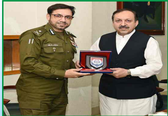
آئی جی پنجاب ڈاکٹر سید کلیم امام، چیف سیکرٹری پنجاب اکبر حسین ڈرائی کو پنجاب پولیس کی جانب سے یادگاری شیلڈ پیش کرتے ہوئے

Free, fair, and transparent elections are the prime responsibility of the Police.