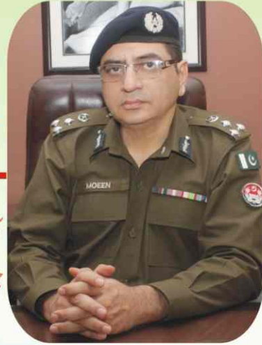
ڈاکٹر معین مسعود شی پولیس آفیسر گوجرانوالہ

آئین اور قانون کی بالادستی اولین مقصد ہے۔ جرائم پیشہ افراد کے ساتھ کوئی رعایت نہ ہوگی۔