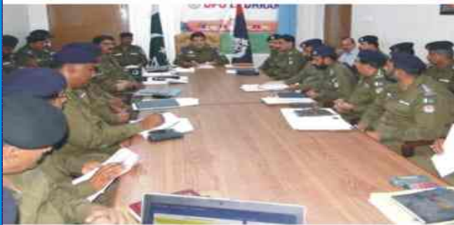
لودھراں: ڈی پی او عثمان اعجاز باجوہ اپنے آفس میں پولیس آفیسران سے میٹنگ کر رہے ہیں۔