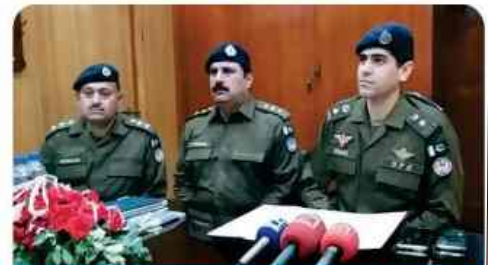
DPO Sheikhupura held press conference in connection with tracing blind murder case

It was a challenging task to take charge as a DPO Sheikhupura because this district was amongst the biggest districts of the Punjab with respect to crime ratio. Now it is my vision & ambition to chalk out strategies in prevention and eradication of heinous crime & ward off any eventuality which led to the creation of chaos & lawlessness situation. I assure my availability round the clock to serve the general public for redressal of there grievances. I dedicate my self for devising new scheme & policies for the welfare of the force & boost up their moral. I am fully determined to leave no stone unturned & go to any length for conduction of free fare & transparent general Election 2018 in District Sheikhupura.