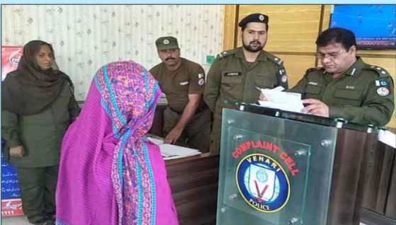
ڈسٹرکٹ پولیس آفیسر احمد ناصر عزیز ورک کھلی کچہری کے دوران مسائل سنتے ہوئے