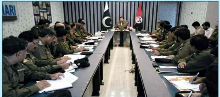
ڈسٹرکٹ پولیس آفیسر احمد ناصر عزیز ورک لاء اینڈ آرڈر کی صورتحال کے حوالے سے میٹنگ کرتے ہوئے۔