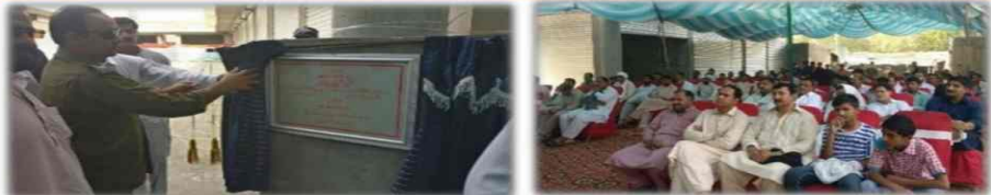
Abrar Hussain DPO Khushab inaugurating Bashir Shaheed Plaza Khushab