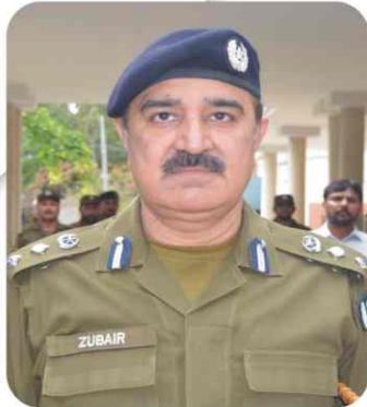
Message of DPO Sargodha

Sargodha District is the 6th biggest District in Punjab. Commanding the District Police Sargodha is quite an honour for me. Being the District Commander of Police, establishment of crime free society is my top priority. I shall personally be available for general public round the clock. Sargodha police is fully committed to serve the public withing its available sources.