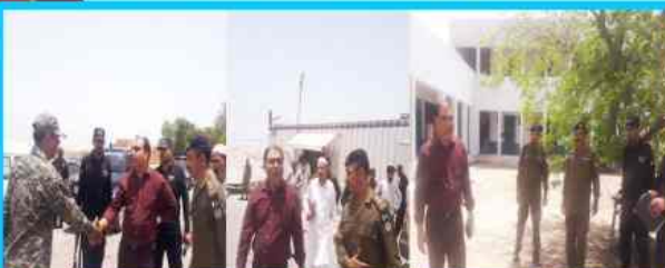
DPO/Bhakkar visited Remote Search Park (Inter Provincial Border Check Post) Dajal, District Bhakkar and Police Station Saddar Darya Khan.