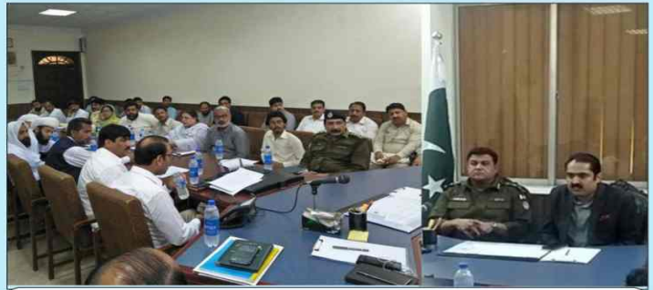
ڈسٹرکٹ پولیس آفیسر احمد ناصر عزیز ورک ایکشن کمیشن کے ضابطہ اخلاق کے حوالے سے امیدواران سے میٹنگ کرتے ہوئے۔