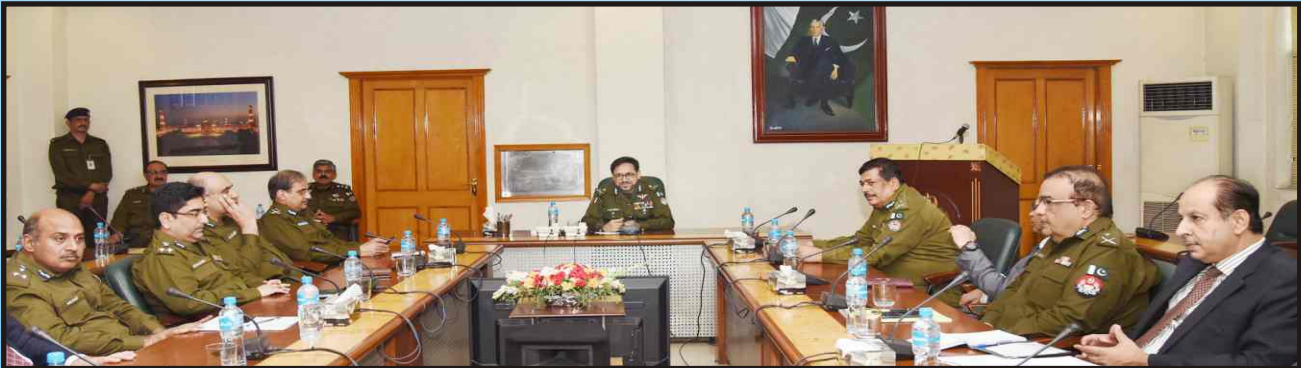
آئی جی پنجاب ڈاکٹر سید کلیم امام سنٹرل پولیس آفس پنجاب لاہور میں سینئر پولیس افسران کی میٹنگ سے خطاب کر رہے ہیں