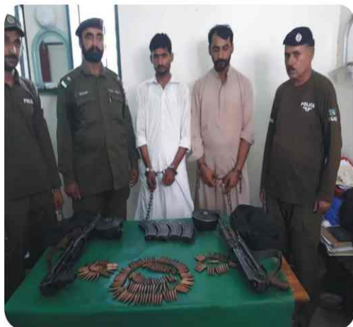
The violators of Code of Conduct of Election are under custody of District Police Toba.