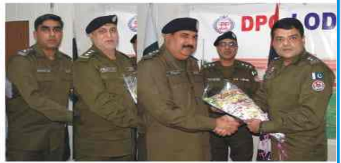
لودھراں: ڈی پی او عثمان اعجاز باجوہ ٹرانسفر ہونے والے ڈی ایس پیز کو گلہ دستہ پیش کر رہے ہیں۔