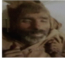
سیریل نمبر 27