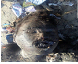
سیریل نمبر 3