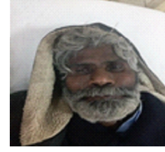
سیریل نمبر 32