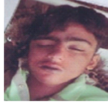
سیریل نمبر 2