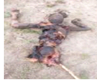
سیریل نمبر 1