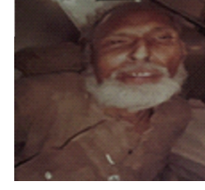
سیریل نمبر 20