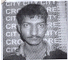
سیریل نمبر 5