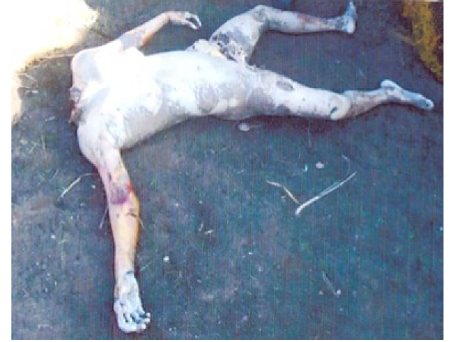
سیریل نمبر 2