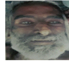
سیریل نمبر 23