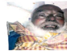
سیریل نمبر 4