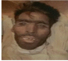
سیریل نمبر 25