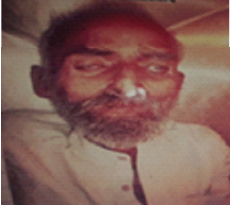
سیریل نمبر 19