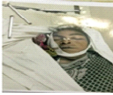
سیریل نمبر 30