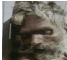
سیریل نمبر 24