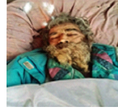
سیریل نمبر 35