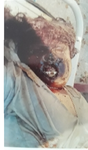
سیریل نمبر 6