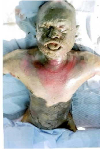
سیریل نمبر 2