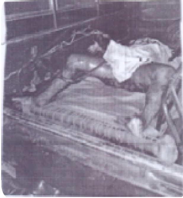
سیریل نمبر 2