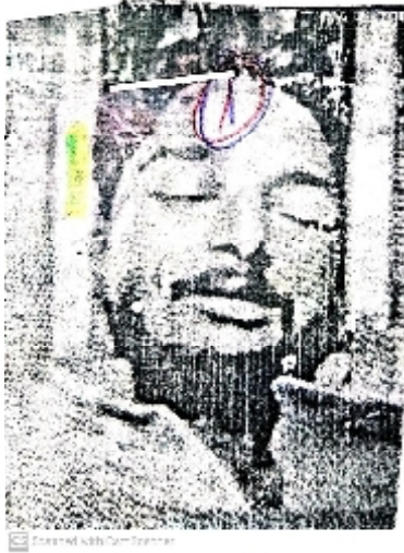
سیریل نمبر 10