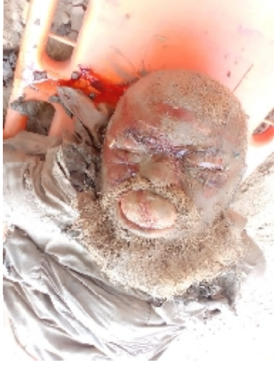
سیریل نمبر 18