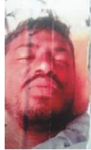
سیریل نمبر 29