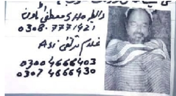
سیریل نمبر 34