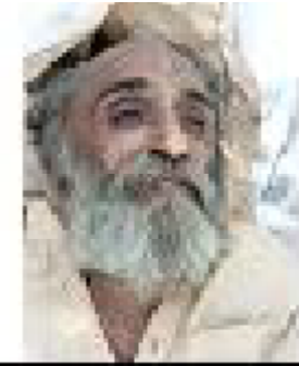
سیریل نمبر 9