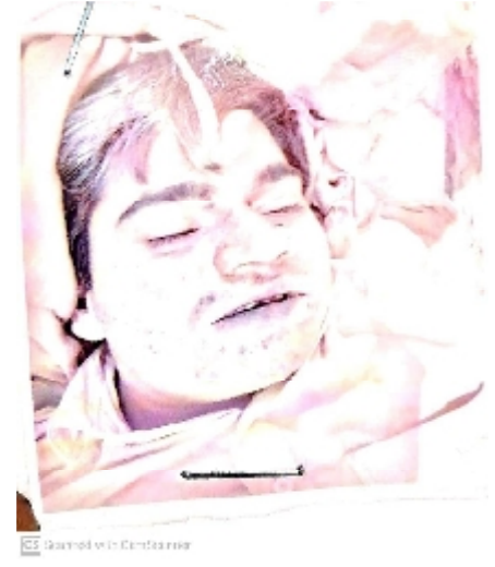
سیریل نمبر 21