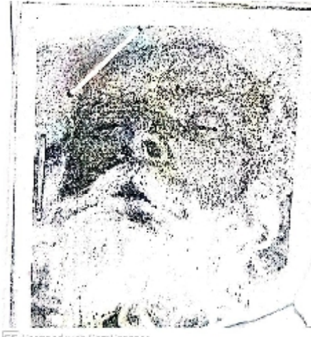
سیریل نمبر 17