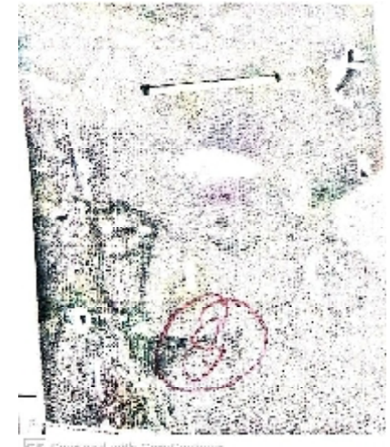
سیریل نمبر 16