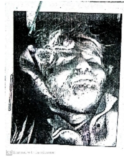
سیریل نمبر 19