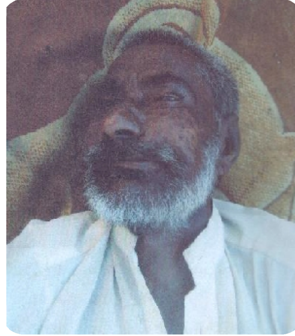
سيريل نمبر 1