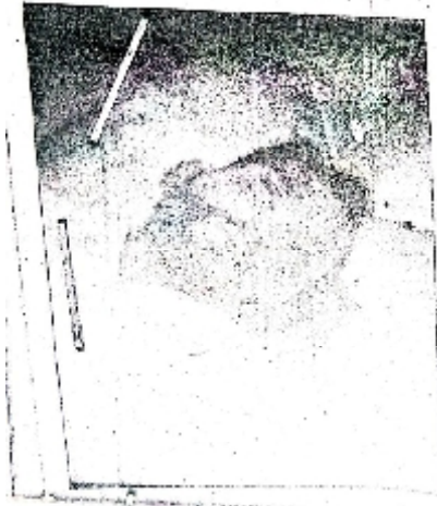
سیریل نمبر 18