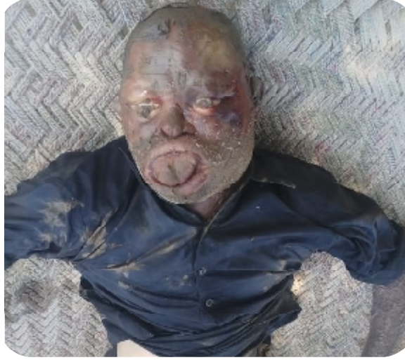
سیریل نمبر 7