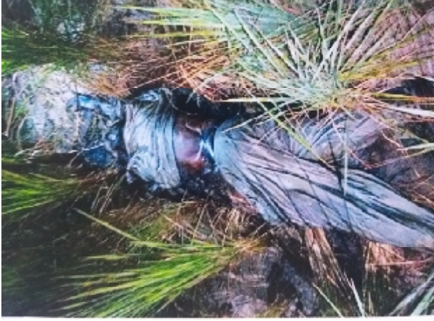
سیریل نمبر 2