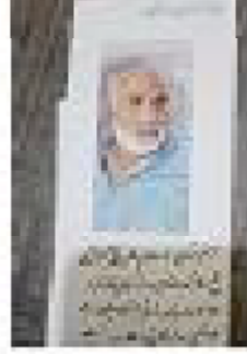
سیریل نمبر 7