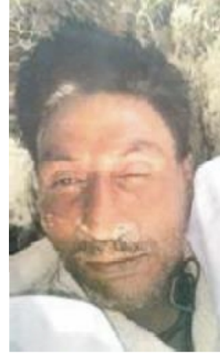
سیریل نمبر 26