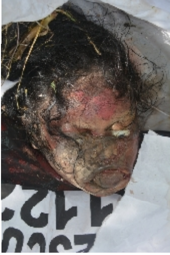
سیریل نمبر 3