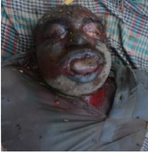
سیریل نمبر 8