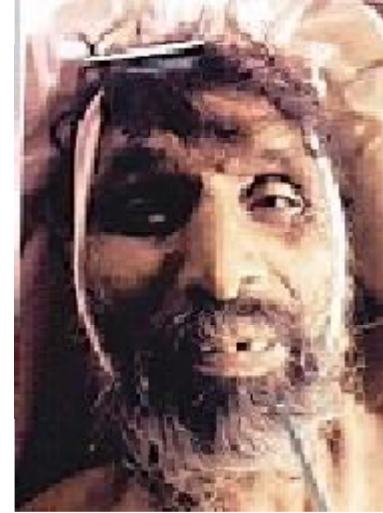
سیریل نمبر 4