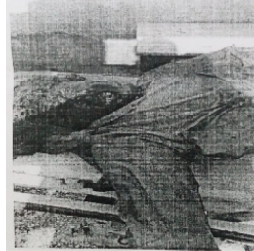
سیریل نمبر 4