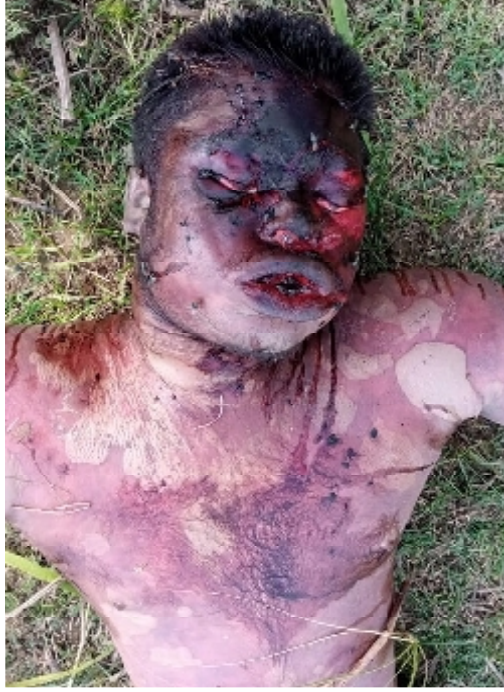
سيريل نمبر 2