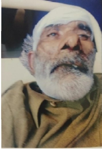
سیریل نمبر 5