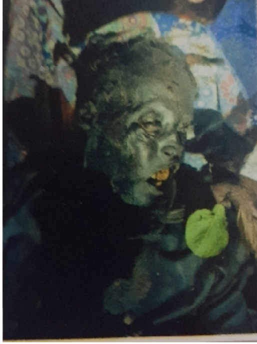
سيريل نمبر 2