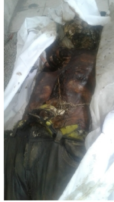
سیریل نمبر 1