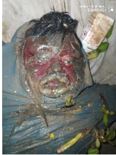
سیریل نمبر 9