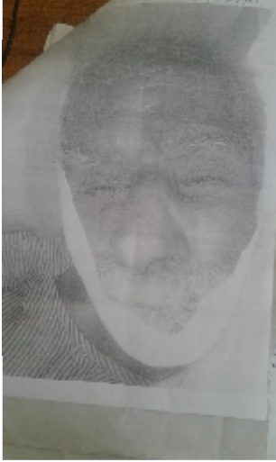
سیریل نمبر 33