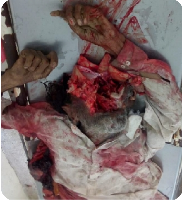
سيريل نمبر 2