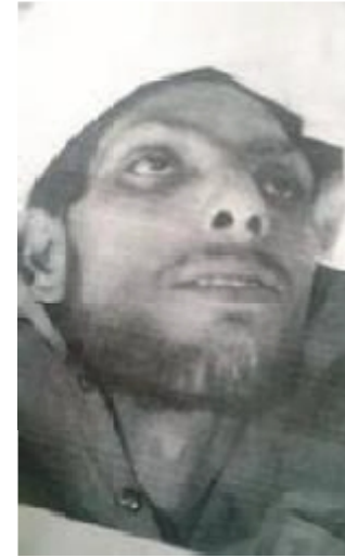
سیریل نمبر 31