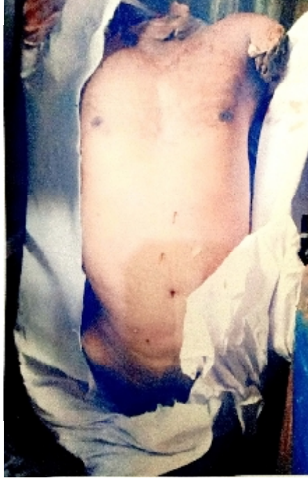
سیریل نمبر 2