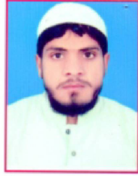
سیریل نمبر 2