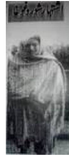
مسماة ہما گل