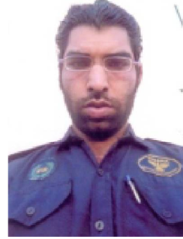
قیصر نوید شاہ کر