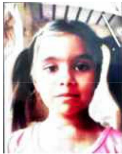
صنم عرف چنوں