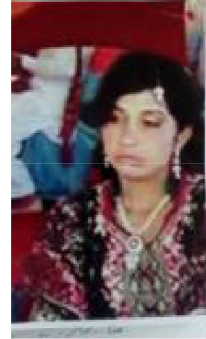
اقصیٰ بی بی