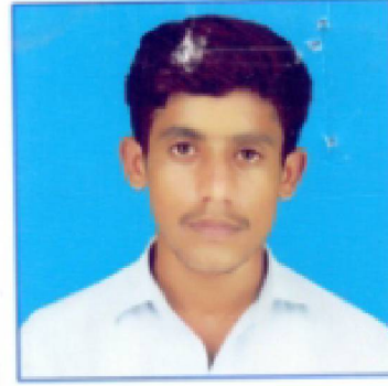
سیریل نمبر 3